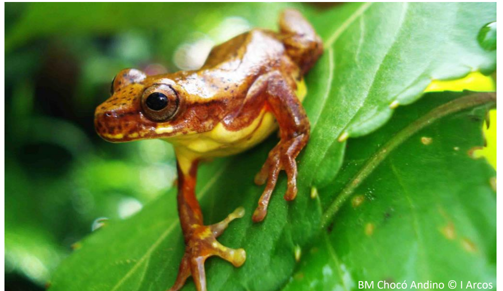
BM Chocó Andino

Las 124 296 Ha que conforman el BMCA están ubicadas en la provincia de Pichincha, en el extremo noroccidental del Distrito Metropolitano de Quito (DMQ) y corresponden al territorio de 6 Parroquias rurales: Calacalí, Nono, Nanegal, Nanegalito, Guala y Pacto. Su paisaje es un mosaico conformado por vegetación natural (52%), áreas cultivadas (28%), vegetación en regeneración natural (16%) e infraestructura (0.54%). El BMCA se encuentra al Norte del Ecuador, en la vertiente pacífica de la cordillera occidental de los Andes, en la subcuenca del Río Guayllabamba, que forma parte de la cuenca del Río Esmeraldas. Por estar dentro de las ecorregiones y hotspots Tumbes - Chocó – Darién y Andes Tropicales, el BMCA posee una gran biodiversidad y endemismo, existiendo al menos 6 especies de mamíferos en la Lista Roja de la UICN y más de 526 especies de aves (11 amenazadas y 24 endémicas). A nivel global se encuentra dentro de dos hotspots que corresponden a las eco-regiones previamente mencionadas. 60% del territorio está bajo diferentes modalidades de conservación y uso sustentable (3 Áreas de Conservación y Uso Sustentable - ACUS declaradas por el Municipio del DMQ, 1 Reserva del Patrimonio de Áreas Naturales del Estado, 8 Bosques Protectores, 20 Reservas Privadas y Comunitarias). Además, el territorio del BM es parte del Corredor Ecológico del Oso Andino ( Tremartus ornatus ), especie en peligro de extinción a nivel local.