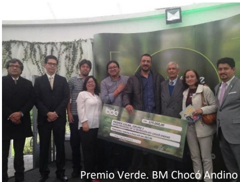
Premio Verde. BM Chocó Andino

✓ Bosque Modelo Chocó-Andino, como parte de la Mancomunidad de Municipios de la Bioregión Chocó-Andino, ganó el primer Premio Verde de Ecuador por la Sustentabilidad, para municipios de más de 100 000 habitantes.