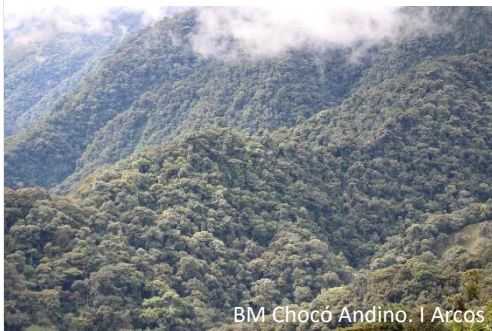
BM Chocó Andino. I Arcos