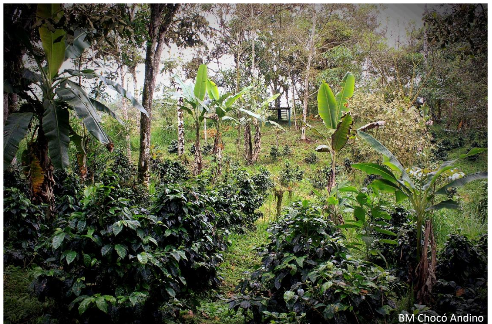
BM Chocó Andino

Las 6 cabeceras parroquiales que conforman el BMCA albergan aproximadamente a 18 000 habitantes que se distribuyen en 70 pequeños asentamientos humanos de cientos de habitantes cada uno. En cuanto a los usos productivos de la tierra predominan los pastizales para la crianza de ganado vacuno, con una extensión aproximada de 27.500 has (22%). Otro cultivo importante a nivel de paisaje es la caña de azúcar, en la parte baja, con una extensión aproximada de 5 800 ha (5%). En menor escala existen áreas de frutales, plataneras, yuca, café, cacao, palmito, maíz, fréjol, papas y plantaciones de especies maderables. También existen instalaciones para piscicultura y algunos planteles avícolas y florícolas, en especial en la parte alta. Es importante mencionar la presencia de proyectos hidroeléctricos en el territorio. Manduriacu (60 MW), en el extremo occidental del territorio y que represa el río Guayllabamba en su confluencia con los ríos Manduriacu y Guaycuyacu; y Palmira – Nanegal (10 MW), que canaliza por 3 Km gran parte del caudal del río Alambi en la parroquia de Nanegal.