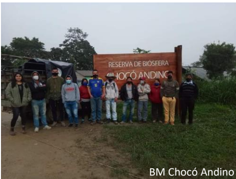
BM Chocó Andino

Ser al 2030 una organización que apoye a la gobernanza participativa que ha logrado la conservación de bosques, de su biodiversidad y de las fuentes de agua, con un territorio sin actividades extractivas; con sistemas productivos y medios de vida regenerativos y resilientes; con identidades culturales propias que garantizan el buen vivir.