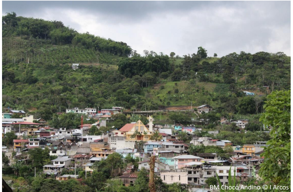
BM Chocó Andino

Las 6 cabeceras parroquiales que conforman el BMCA albergan aproximadamente a 18 000 habitantes que se distribuyen en 70 pequeños asentamientos humanos de cientos de habitantes cada uno. En cuanto a los usos productivos de la tierra predominan los pastizales para la crianza de ganado vacuno, con una extensión aproximada de 27.500 has (22%). Otro cultivo importante a nivel de paisaje es la caña de azúcar, en la parte baja, con una extensión aproximada de 5 800 ha (5%). En menor escala existen áreas de frutales, plataneras, yuca, café, cacao, palmito, maíz, fréjol, papas y plantaciones de especies maderables. También existen instalaciones para piscicultura y algunos planteles avícolas y florícolas, en especial en la parte alta. Es importante mencionar la presencia de proyectos hidroeléctricos en el territorio. Manduriacu (60 MW), en el extremo occidental del territorio y que represa el río Guayllabamba en su confluencia con los ríos Manduriacu y Guaycuyacu; y Palmira – Nanegal (10 MW), que canaliza por 3 Km gran parte del caudal del río Alambi en la parroquia de Nanegal.