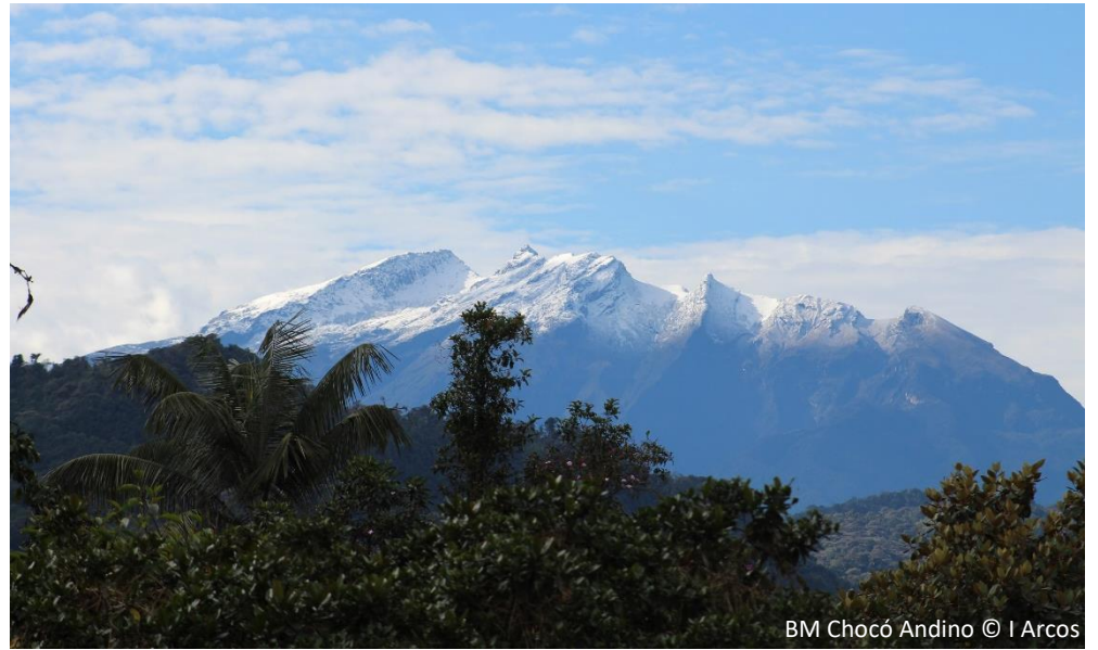
BM Chocó Andino

Las 124 296 Ha que conforman el BMCA están ubicadas en la provincia de Pichincha, en el extremo noroccidental del Distrito Metropolitano de Quito (DMQ) y corresponden al territorio de 6 Parroquias rurales: Calacalí, Nono, Nanegal, Nanegalito, Guala y Pacto. Su paisaje es un mosaico conformado por vegetación natural (52%), áreas cultivadas (28%), vegetación en regeneración natural (16%) e infraestructura (0.54%). El BMCA se encuentra al Norte del Ecuador, en la vertiente pacífica de la cordillera occidental de los Andes, en la subcuenca del Río Guayllabamba, que forma parte de la cuenca del Río Esmeraldas. Por estar dentro de las ecorregiones y hotspots Tumbes - Chocó – Darién y Andes Tropicales, el BMCA posee una gran biodiversidad y endemismo, existiendo al menos 6 especies de mamíferos en la Lista Roja de la UICN y más de 526 especies de aves (11 amenazadas y 24 endémicas). A nivel global se encuentra dentro de dos hotspots que corresponden a las eco-regiones previamente mencionadas. 60% del territorio está bajo diferentes modalidades de conservación y uso sustentable (3 Áreas de Conservación y Uso Sustentable - ACUS declaradas por el Municipio del DMQ, 1 Reserva del Patrimonio de Áreas Naturales del Estado, 8 Bosques Protectores, 20 Reservas Privadas y Comunitarias). Además, el territorio del BM es parte del Corredor Ecológico del Oso Andino ( Tremartus ornatus ), especie en peligro de extinción a nivel local.