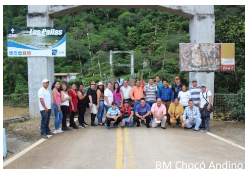
BM Chocó Andino

El Bosque Modelo del Chocó Andino implementa su Plan de Gestión alineado al Plan de Gestión de la Mancomunidad, para proteger la biodiversidad y el ambiente; incentivar el fomento productivo regenerativo y resiliente; facilitar el ejercicio de derechos y fortalecer las identidades culturales hacia el desarrollo integral de su población, mediante la articulación con el estado, la sociedad civil y el sector privado.